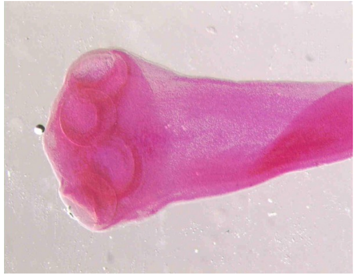
Tasiemiec nieuzbrojony – Taenia saginata, główka- skoleks, zdjęcie mikroskopowe