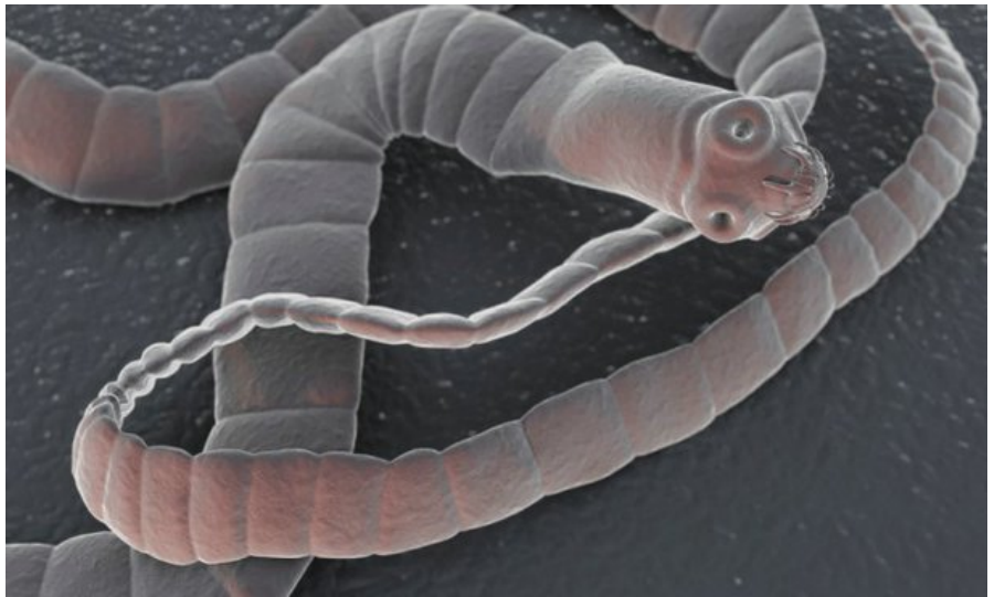
Tasiemiec uzbrojony – Taenia solium

Płazinię ten, podobnie jak tasiemiec nieuzbrojony, pasożytuje w jelicie cienkim człowieka. Dotyka ludzi w każdym wieku, ale głównym obszarem zakażeń są regiony o niskiej świadomości higieny. Człowiek zaraża się głównie poprzez mięso wieprzowe. Najwięcej zakażeń obserwuje się w wilgotnej strefie podzwrotnikowej. Tasiemiec ten należy do gatunków mniejszych, osiągając maksymalnie 8 m. Składa się przeciętnie z 1000 segmentów – proglotydów.