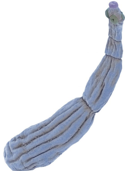
Tasiemiec bąbłowcowy – Echinococcus granulosus

Płazinię ten występujący na całej kuli ziemskiej w jelicie cienkim psowatych. Człowiek nie jest jego żywicielem specyficznym, a jedynie jednym z wielu pośrednich. Jest niewielkich rozmiarów, zwykle osiąga długość kilku milimetrów. Składa się ze skoleksa, która jest największym członem – główki oraz 3 segmentów, czyli proglotydy, ten ostatni jest