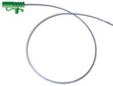
sonda do karmienia niemowląt