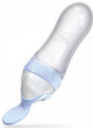
NUBY – łyżeczka do podawania pokarmu