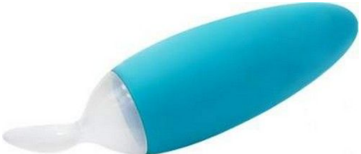
B00N – łyżeczka do podawania pokarmu