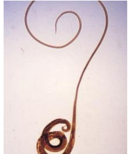
Włosogłówka ludzka – Trichuris trichiura

2-go co do częstotliwości występowania w Polsce pasożyt człowieka. Bytuje w kątnicy i jelicie grubym człowieka, szczególnie popularny w strefie klimatów ciepłych, w umiarkowanych rzadziej, Szacuje się że w Polsce może być zarażonych nawet 25% ludności. Osiąga od 30-52 mm długości i 0,65 – 0,82 mm średnicy. Samica składa 1-6 tysięcy jaj dziennie.