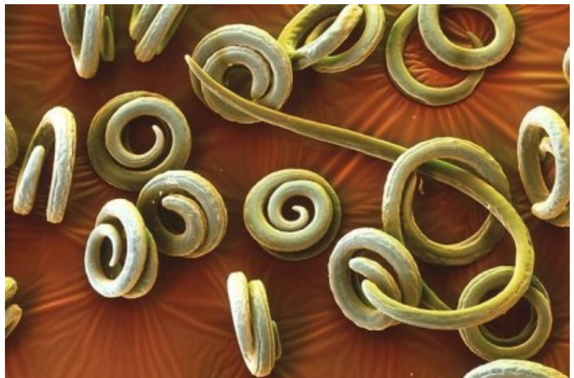
Włosień kręty – Trichinella spiralis