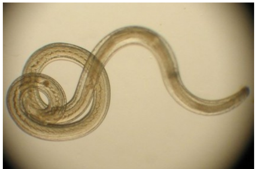
Glista ludzka – Ascaris lumbricoides hominis , interia.pl