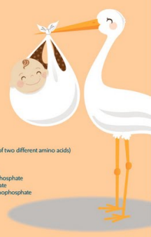
Developed as a student project for the Breastfeeding Course for Health Care Providers, Douglas College, New Westminster BC, Canada - © 2007 by Cecily Hielett, Sherri Hedberg and Haley Rumble.

WATER CARBOHYDRATES Lactose Corn maltodextrin PROTEIN Partially hydrolyzed reduced minerals whey protein concentrate (from cow's milk) FATS Palm olein Soybean oil Coconut oil High oleic safflower oil (or sunflower oil) M. alpha oil (fungal DHA) C.ohni oil (Algal ARA) MINERALS Potassium citrate Potassium phosphate Calcium chloride Calcium phosphate Sodium citrate Magnesium chloride Ferrous sulphate Zinc sulphate Sodium chloride Copper sulphate Potassium iodide Manganese sulphate Sodium selenate VITAMINS Sodium ascorbate Inositol Choline bitartrate Alpha-Tocopheryl acetate Niacinamide Calcium pantothenate Riboflavin Vitamin A acetate Pyridoxine hydrochloride Thiamine mononitrate Folic acid Phylloquinone Biotin Vitamin D3 Vitamin B12 ENZYME Trypsin AMINO ACID Taurine L-Carnitine (a combination of two different amino acids) NUCLEOTIDES Cytidine 5-monophosphate Disodium uridine 5-monophosphate Adenosine 5-monophosphate Disodium guanosine 5-monophosphate Soy Lecithin