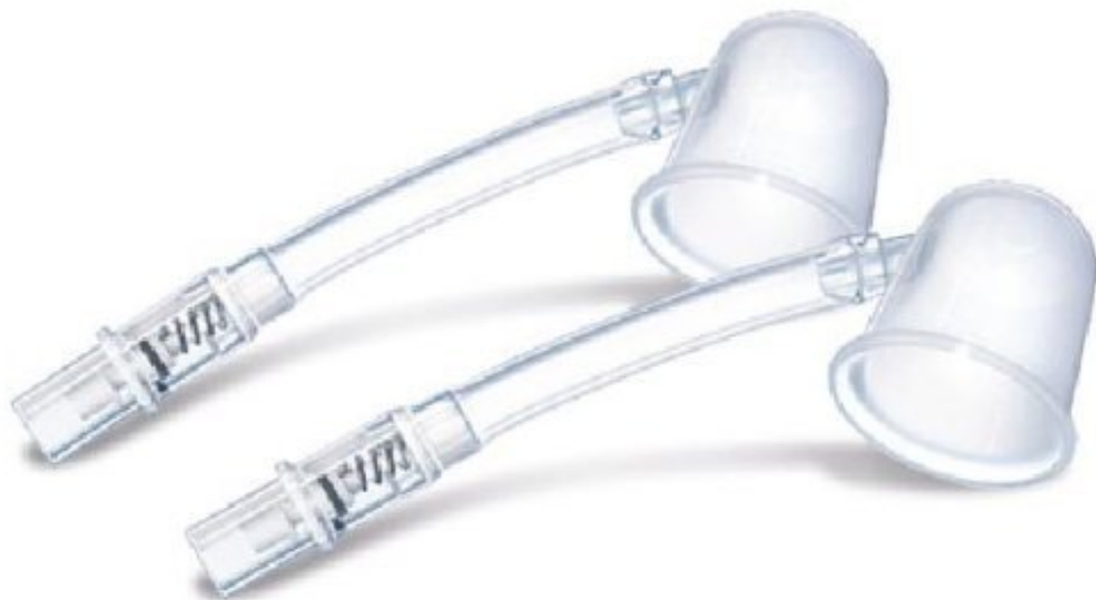
avent – nipplette

Przed karmieniem można korzystać z laktatora, muszli formujących, muszle przydają się także, przy maceracji brodawek, oraz jako zamiennik wkładek laktacyjnych, gdyż można w nich zbierać pokarm, nipple, czy strzykawek