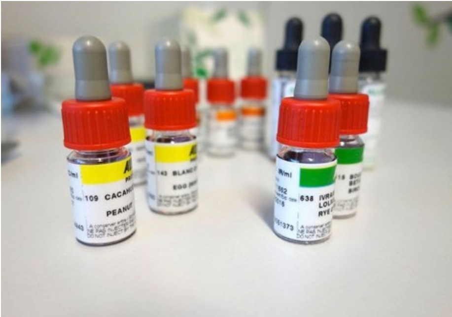
koncentraty alergenów