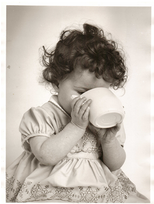
Zdjęcie do reklamy DoidyCup, Lata 50-te

Pojawiło się w okresie międzywojennym, a rozwinęło po wojnie, wraz z rozwojem mleka w proszku i mieszanek (na zachodzie). Takie preparaty powodowały poważne zaparcia i konieczne było podawanie dzieciom płynów, aby ułatwić wypróżnienie. Do tego, od połowy XX wieku karmiono dzieci wg schematów i stosowano tzw. zimny chów, który zakładał, że