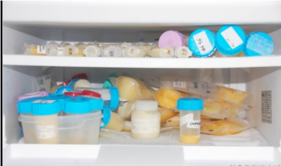
próbki do testów