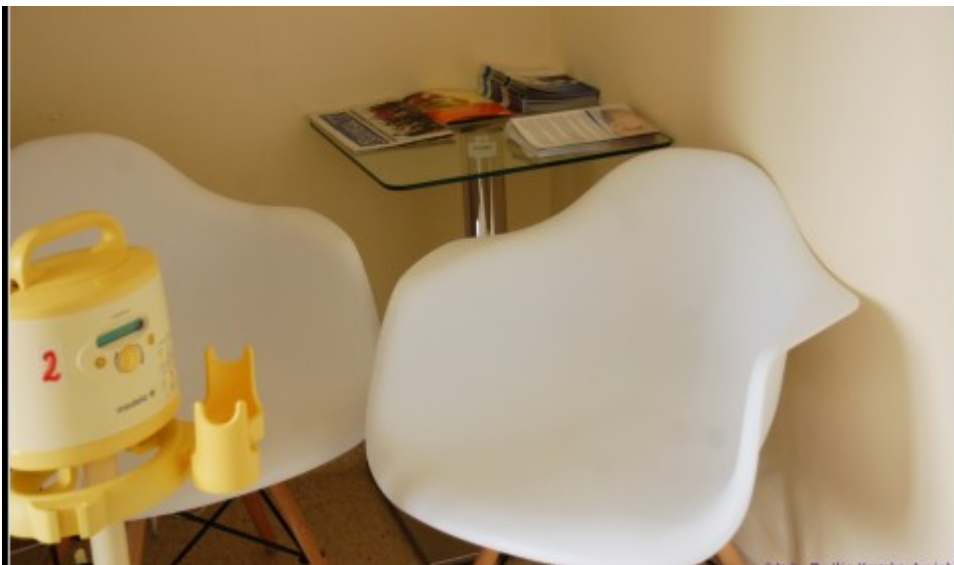
miejsce do pozyskiwania pokarmu

Bank we Wrocławiu jest 6 w Polsce bankiem mleka kobiecego działającym przy wsparciu Fundacji Bank Mleka Kobiecego, a kolejne 4 banki są w trakcie tworzenia. Jest to proces długotrwały, wymagający zaangażowania wielu osób, ale przede wszystkim stworzenia miejsca to pozyskiwania pokarmu, a następnie przygotowywania, przechowywania, jak i analizowania. Miejsce to musi spełniać określone kryteria i mieć odpowiednie wyposażenie.