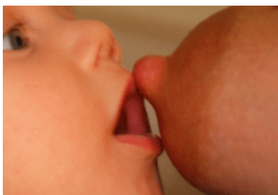
drażnienie ust dziecka brodawką