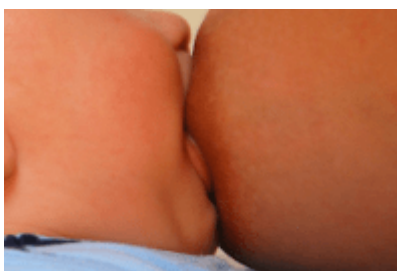
prawidłowe ssanie piersi

Efektywne pobieranie pokarmu jest uwarunkowane prawidłowym ssaniem. Ssanie składa się z 2 faz: fazy zasysania i fazy kompresji.