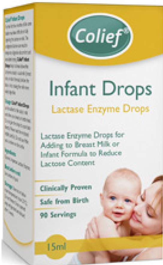
Delicol – enzym laktaza –