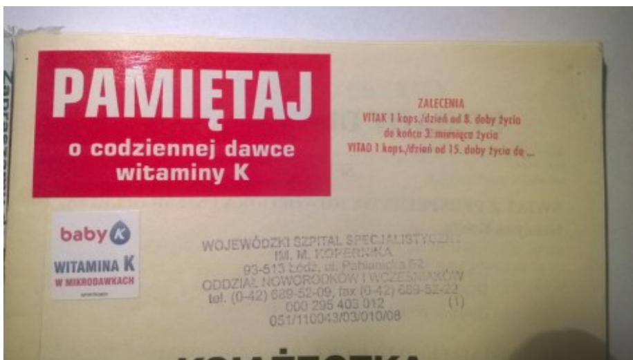
Zalecenia w książeczce 2008