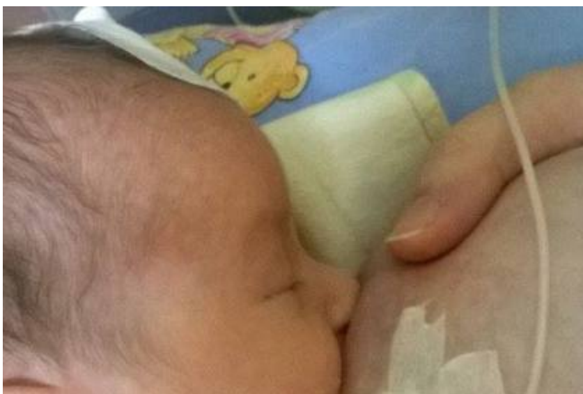
supplemental nursing system – SNS – archiwum prywatne mamy – zdjęcie poglądowe System służący do dokarmiania, lub pobudzania laktacji,