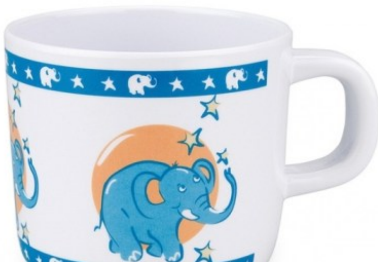
kubek otwarty – zdjęcie poglądowe

można też zaproponować bidon z rurką zassanie płynu z takiego bidonu wymaga innej techniki niż w przypadku butelki czy zwykłego niekapka.