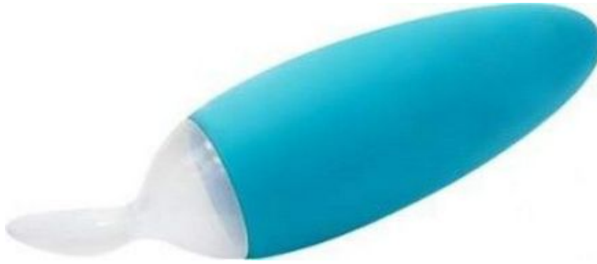
B00N – łyżeczka do podawania pokarmu