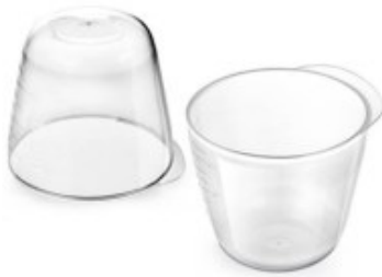
lovi – kubeczek do pojenia noworodków i niemowląt