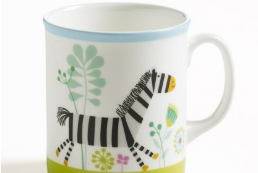
kubek otwarty – zdjęcie poglądowe

Jeśli dziecko nie pije z 2 powyższych kubków (DOIDY lub LOVI 360), z powodzeniem można wprowadzić najzwyczajniejszy otwarty kubek i dziecko może się uczyć z niego pić, lub niekapek bez przykrycia