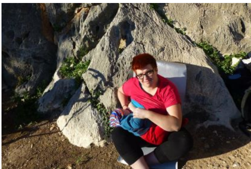
szlak w górach